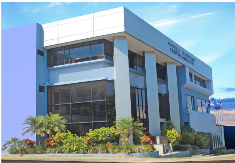
EDIFICIO SEDE DE LA SECRETARÍA EJECUTIVA DEL CONSEJO MONETARIO CENTROAMERICANO SAN JOSÉ, COSTA RICA