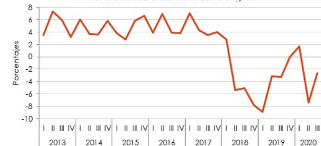
Nicaragua: Producto interno bruto en constantes (volúmenes encadenados) al III trimestre de 2020 Variación interanual de la serie original