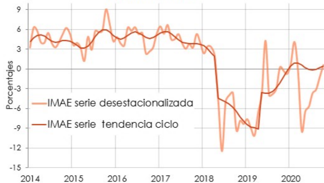
Indice Mensual de Actividad Económica Variación interanual